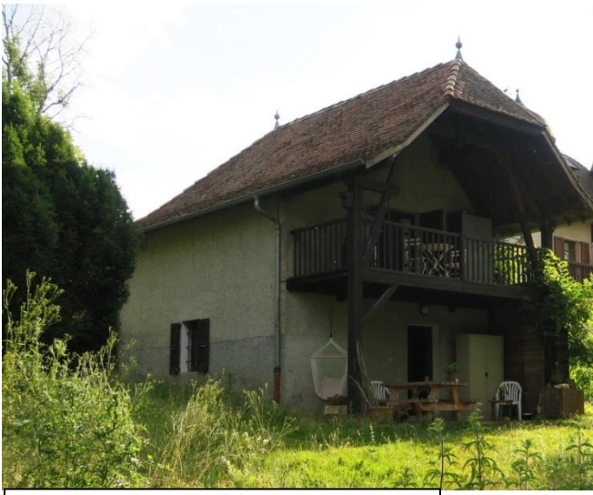
Photos de la maison