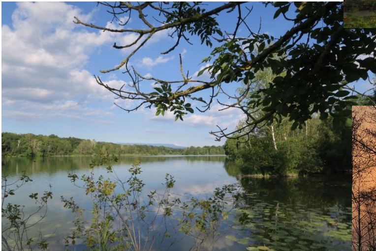
Lac de Save