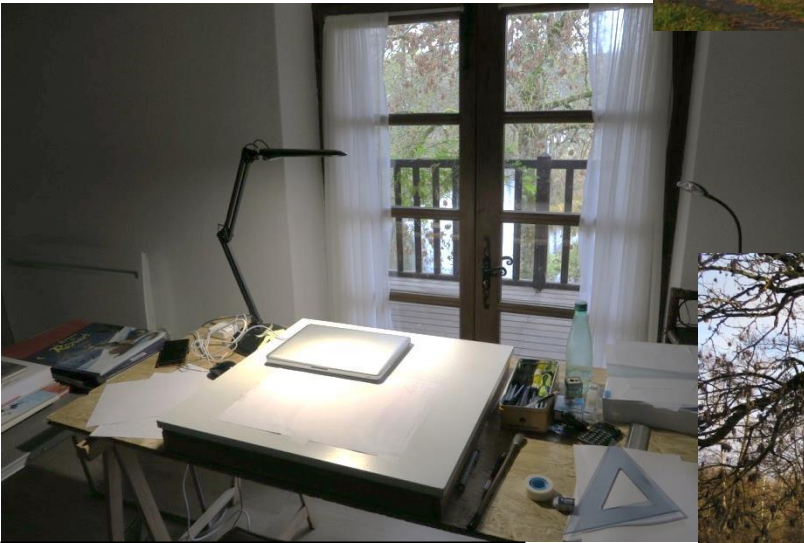
Plan de travail et vue depuis la terrasse