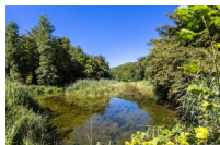
@Bertrand Bodin - Département de l'Isère