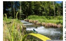
@Bertrand Bodin - Département de l'Isère